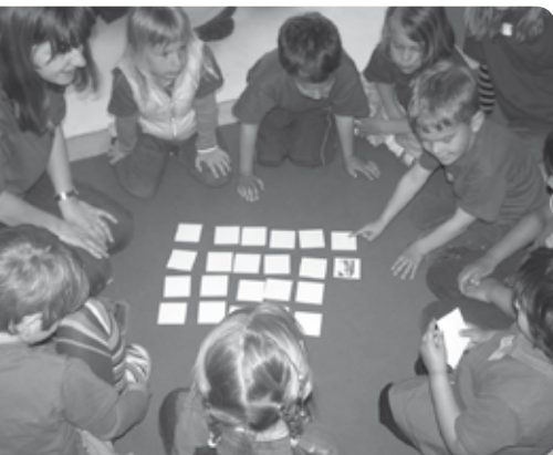
Memory in der Kleingruppe

Jetzt beginnt eine Art Ping-Pong Spiel! Zuerst wird gesungen und wichtige Infos und Regeln werden bekannt gegeben. Nach ein bis zwei weiteren Liedern wird ein kleiner Einstieg ins Thema gemacht. Danach findet eine Kleingruppenrunde statt. Ist diese vorbei, geht das Plenum weiter mit Geschichten aus der Bibel oder Beispielgeschichten und weiteren Liedern. Dazwischen gibt es Spiele, welche in der Kleingruppe oder als ganze Gruppe gespielt werden. In der letzten Kleingruppenzeit wird das Gehörte noch einmal vertieft. Zuletzt wird im Plenum der Sack zugebunden. Es folgen noch kurze Infos zum nächsten Tag und ein Schlusslied.