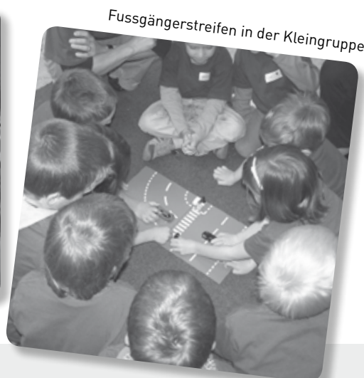
Fussgängerstreifen in der Kleingruppe