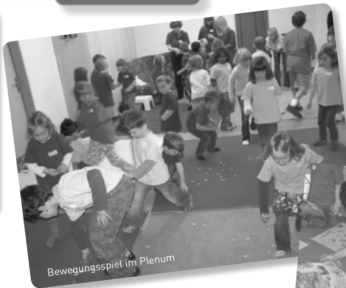
Bewegungsspiel im Plenum

Uf Entdeckigsreis im Verkehr, Tagesthema Fussgängerstreifen.