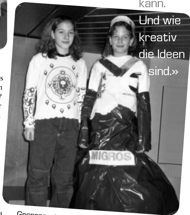
Gesponsert von der Migros