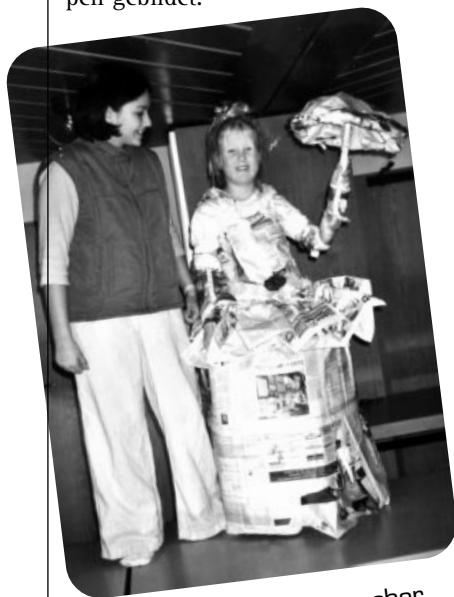
Biedermeier in der Jungschar

«Es erstaunt, was in nur zwei Stunden alles geschneidert werden kann. Und wie kreativ die Ideen sind.»