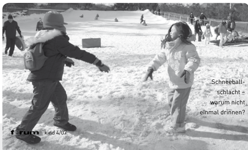
Schneeball-schlacht – warum nicht einmal drinnen?

Welches Team ist am treffsichersten? Zwei Teams (oder auch nur zwei Personen) stehen sich mit etwa zehn Metern Abstand gegenüber, in der Mitte liegt ein Wasserball. Vor jedem Team ist in zwei Metern Abstand eine Ziellinie in den Schnee geritzt. Die Teams versuchen nun, den Wasserball mit Schneebällen so zu treffen, dass er über die Ziellinie des gegnerischen Teams rollt. Action!