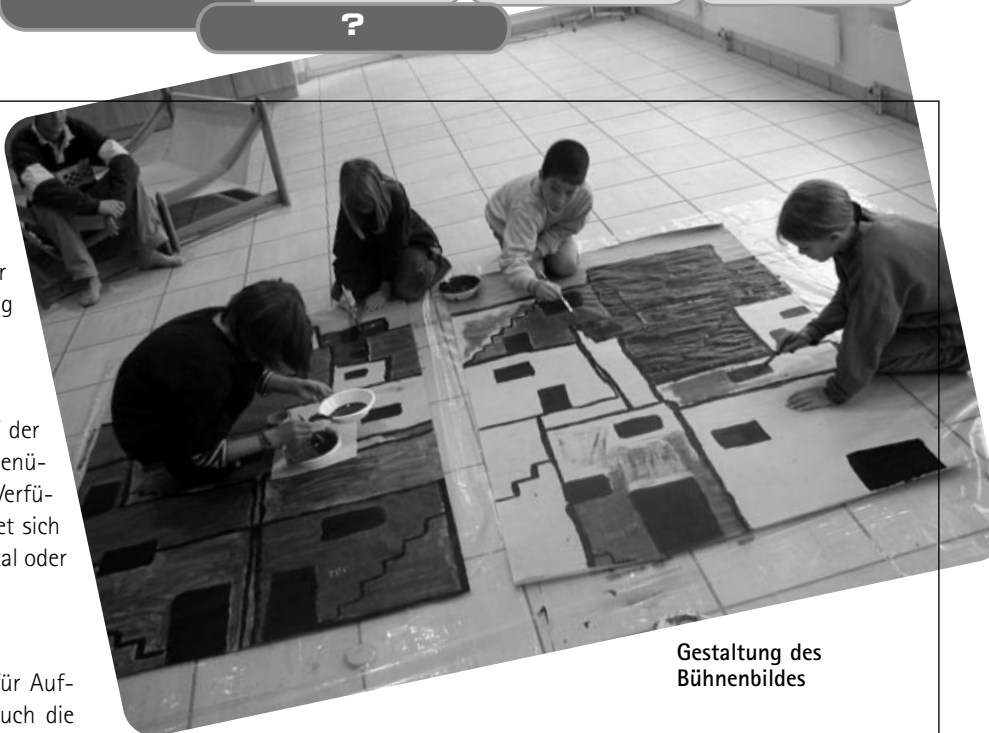
Gestaltung des Bühnenbildes

Auch ein Inserat, bzw. ein kurzer Artikel in der Zeitung, vor und nach dem Auftritt, bieten nicht viel Aufwand.