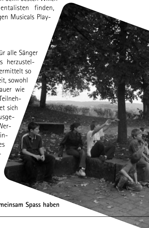
Gemeinsam Spass haben

Es lohnt sich, für alle Sänger gleiche T-Shirts herzustellen. Der Chor vermittelt so eine klare Einheit, sowohl für den Zuschauer wie auch für die Teilnehmer. Dazu eignet sich ein T-Shirt ausgezeichnet als Werbeträger. Die Kinder können es bereits im Vorfeld tragen.