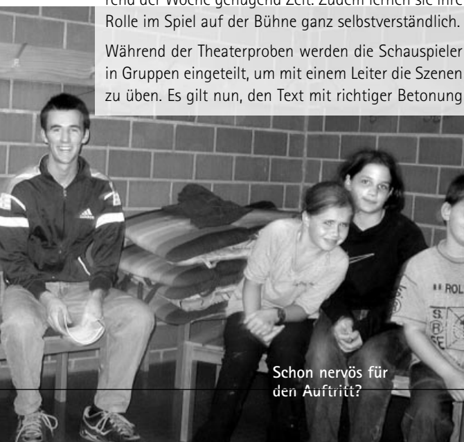
Schon nervös für den Auftritt?

Brauchen die Kinder eine Abwechslung, hat auch mal ein Spiel Platz... Die Leiter sollen unbedingt mitspielen und Beziehungen pflegen.