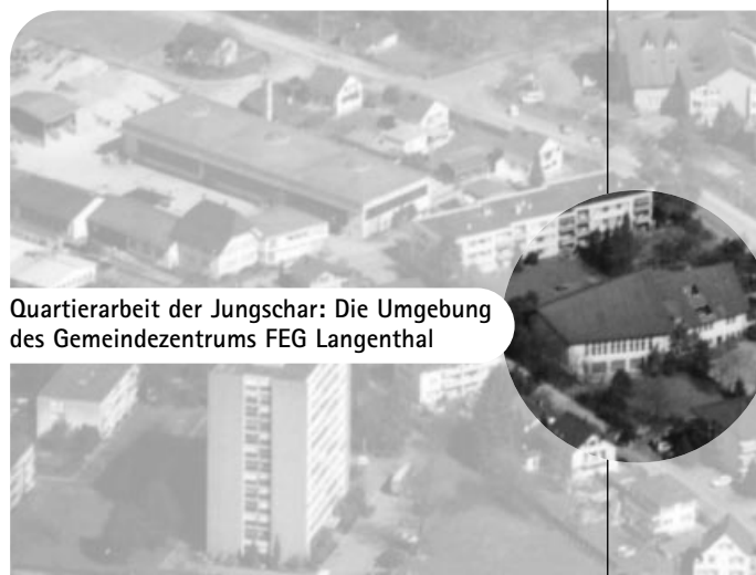
Quartierarbeit der Jungschar: Die Umgebung des Gemeindezentrums FEG Langenthal

Das Gemeindezentrum der Freien Evangelischen Gemeinde Langenthal (FEG) feierte 20jähriges Bestehen. Der Wunsch war da, für die Nachbarschaft ein positives Zeichen zu setzen. So organisierten wir im Sommer ein Quartierfest, zu dem wir alle Nachbarn persönlich einluden. Festwirtschaft, Glace, Getränke,