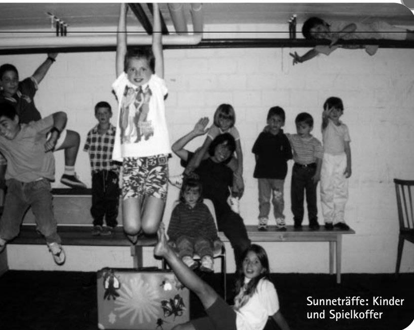
Sunneträffe: Kinder und Spielkoffer

Musik der Jugend-Band, Hausführungen... Und natürlich boten die Jungschar- und Ameisli-LeiterInnen Spiele und Aktivitäten für Kinder an. Auch die Nachbarn gestalteten das Fest mit: Einerseits durch ausländische Spezialitäten kulinarischer Art. Zwei Mädchen einer indischen Familie präsentierten zudem einen indischen Tanz in ihren schönen Kostümen.