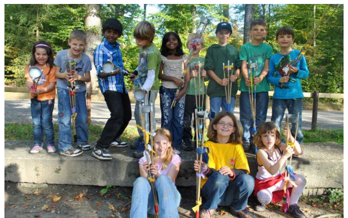
Die Pumas und Ameisli beim Fackeln basteln

Die Pumas und Ameisli gingen auf den Heiternplatz und hatten an diesem Nachmittag Fackeln gebaut, welche zum erleuchten des königlichen Palastes sehr geeignet sind oder auch an privaten Anlässen toll aussehen. Am Ende des Nachmittags wurde Ester dann zur neuen Königin auserwählt, Sie schlug sich im Casting des Königs wirklich ausgezeichnet.