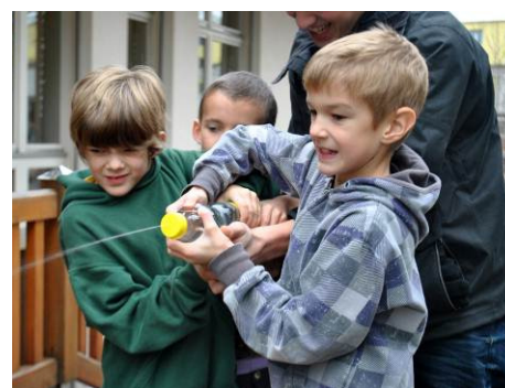
Nur für den Fall, dass das Flambieren danebengeht