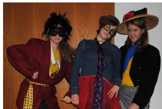
Korrekt gekleidet macht ein Restaurant, doch gleich einen viel besseren Eindruck

Da wurde dem König natürlich sofort klar, dass das nur Haman sein konnte. Er liess ihn an dem Galgen aufhängen, den dieser für Mordachai aufgestellt hatte und machte Mordachai zu seinem neuen Berater. Dann sorgte er dafür, dass die Juden nicht vernichtet werden würden. Wir haben ein Interessantes Semester zusammen mit Ester