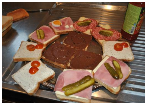
Unser lecker vorbereitetes Zvieri