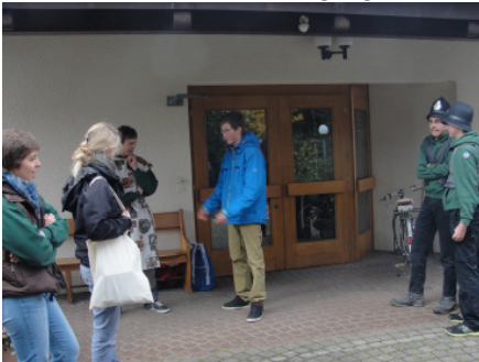
Mordechai verneigt sich nicht vor Haman – die Wächter verpeifen ihn!

Als wir den heutigen Jungschi-Nachmittag beginnen wollten, herrschte bereits ziemliche Aufregung. Haman scheint vom König befördert worden zu sein, jedenfalls mussten sich nun alle vor ihm verbeugen. Nur Mordechai wollte wieder eine Extrawurst haben und weigerte sich. Weil das einige Wachen sahen (und es natürlich gleich Haman erzählen gingen), kamen sie wenig später mit einem geheimnisvollen Brief zurück und machten sich davon. Weil wir wissen wollten, was in diesem Brief stand, gingen wir