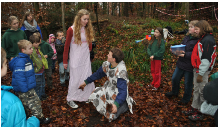
Mordechai hat den Brief gelesen und ist am Boden zerstört. Kann Esther den Juden helfen?

Dort waren wir nicht ganz alleine: auch die OL-Läufer hatten dort ihr Quartier aufgeschlagen.