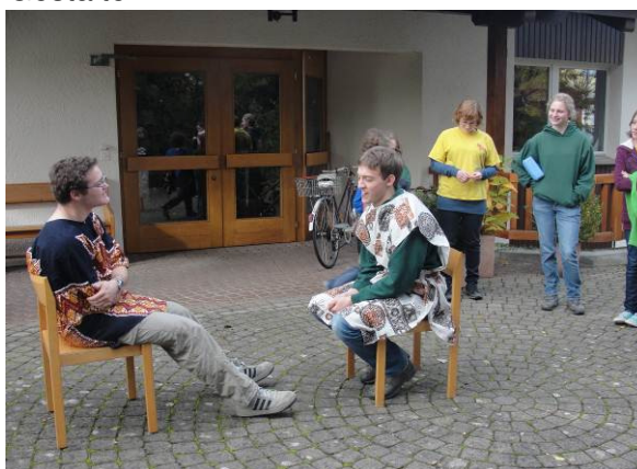
Mordachai und Haman beim Bewerbungsgespräch.

Ansonsten erlebten wir noch einen ganz gemütlichen Rest des Nachmittags.