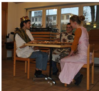
Haman, der König und Ester beim Essen