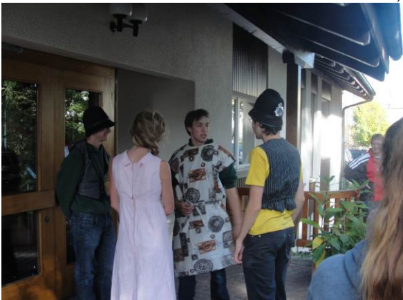
Ester wird in den Palast gebracht

Als wir uns an diesem Samstag vor der Chrischona trafen, wurde Esther gerade ausgewählt. Sie wurde zusammen mit anderen Frauen zum König gebracht. Wie wir schon wussten, hatte der König ja keine Frau mehr, da er Wasti verbannt hatte.