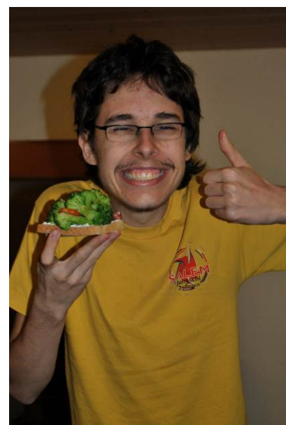
tegi mit seinem Broccoli-Brötchen