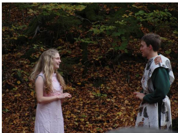
Mordachai erzählt Ester alles was er gesehen hat