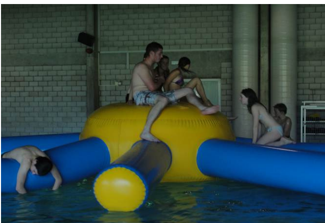
Die Bisons beim Besetzen des Tintenfischs

Wir wollten ihr natürlich folgen aber die Bisons durften nicht, da sie zu dreckig waren um in den Palast gelassen zu werden. So