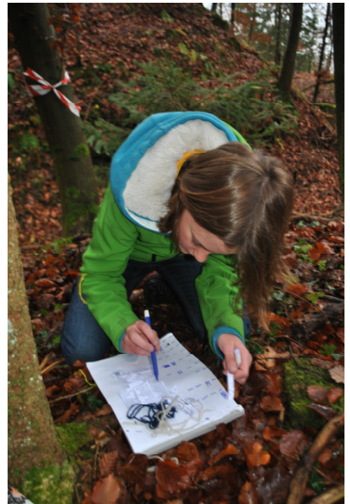
Eine Jungschärlerin versucht, die codierte Nachricht zu entschlüsseln

Palast in ihr eigenes Depot brachten. Am Schluss des Spiels konnten wir den Brief entschlüsseln. Darin stand, dass Haman alle Juden umbringen lassen wollte.