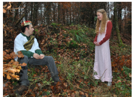
Die Königin Esther lädt ihren Mann zum Essen ein.

Das getraute sie sich zwar noch nicht – aber sie lud ihn mit Haman zum Essen ein. Das findet dann am nächsten JS-Nachmittag statt.